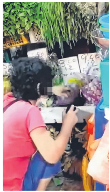
卖菜嫂往一包包的蒜头喷杀虫剂的视频在网上疯传。