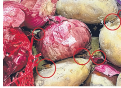
小蟑螂和虫子在马铃薯、大葱上爬行。菜摊摆放的蔬果凌乱，很多串香蕉都发黑和发出臭味，地上可见樟脑丸。

她说，或许有些公众在不知情的情况下买了蔬果是水果，其中包括客工，所以当局还是有必要关注一下，看看怎么确保卫生安全。